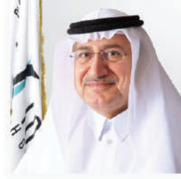
نائب رئيس مجلس الإدارة