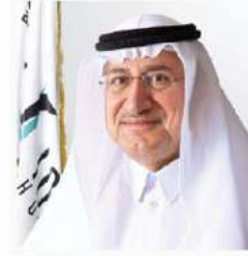
نائب رئيس مجلس الإدارة